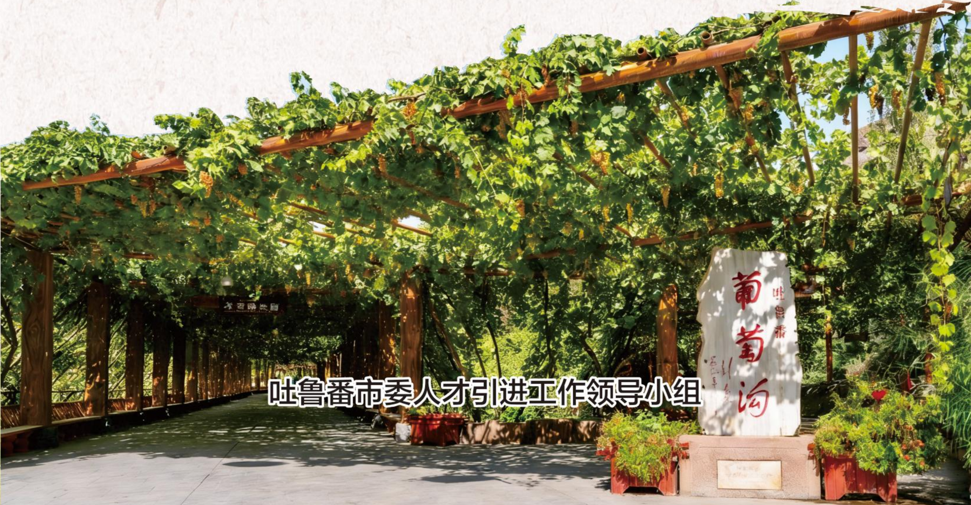
吐鲁番市委人才引进工作领导小组

联系人及电话： 市委组织部人才工作科：0995-8522803； 市人社局事业管理科：0995-7603011