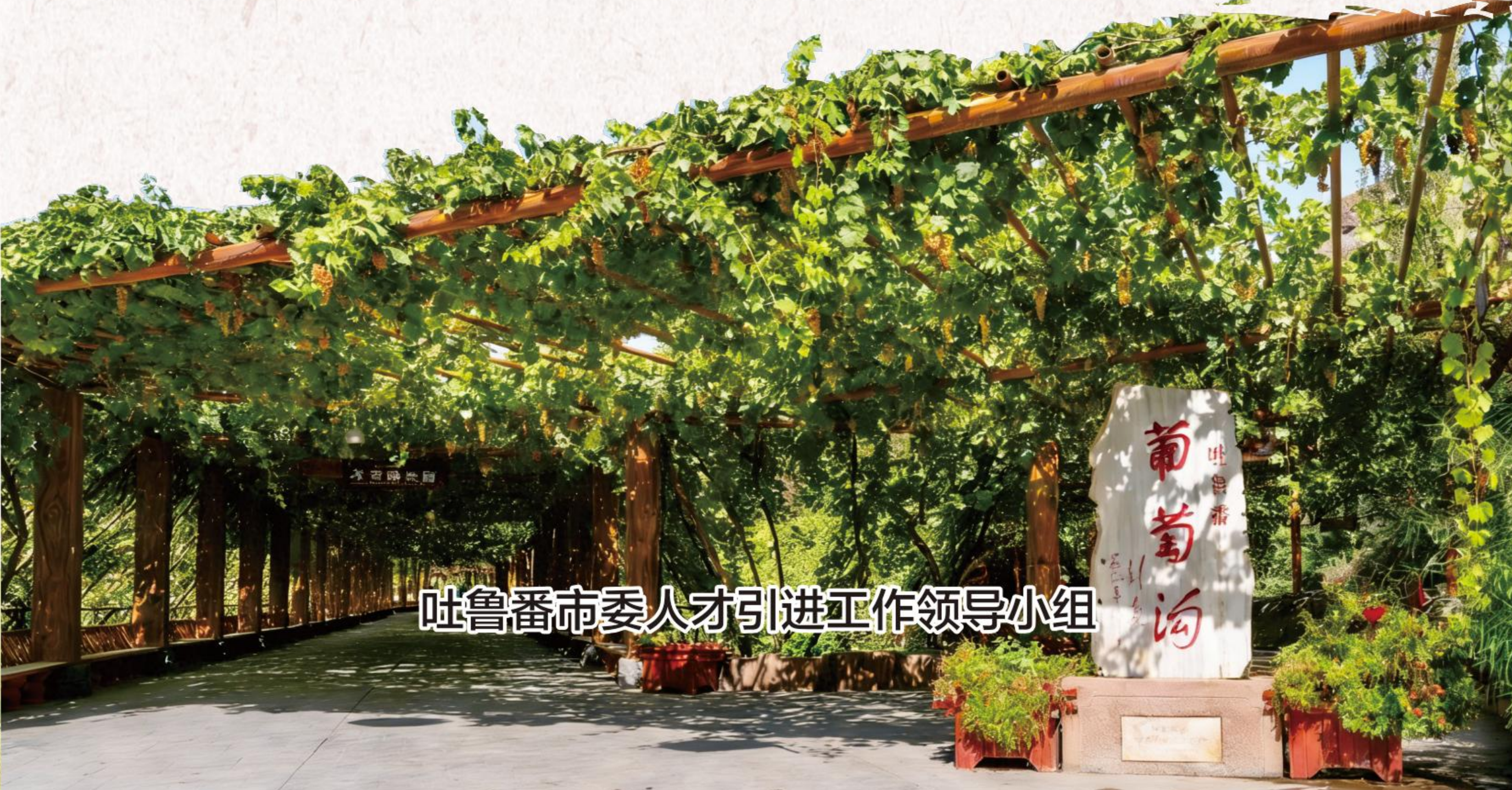
吐鲁番市委人才引进工作领导小组

联系人及电话： 市委组织部人才工作科：0995-8522803； 市人社局事业管理科：0995-7603011